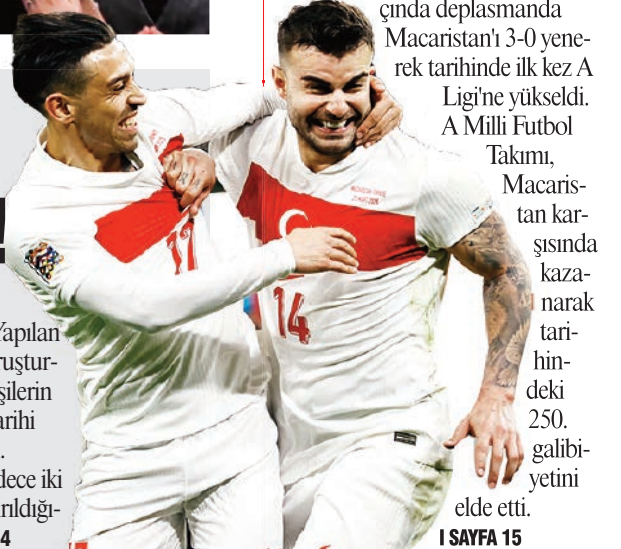
1 SAYFA 15

TRT Haber'in mezar taşı paylaşımı tartışma çıkardı. Yapılan paylaşımda, İBB'deki yolsuzluk soruşturmasına karşı çıkan gruptaki bazı kişilerin Şehzadebaşı Camii'nde bulunan tarihi mezarlara zarar verdiği iddia edildi. İBB'den yapılan açıklamada ise sadece iki mezar taşının kırıldığı, ne zaman kırıldığı'nın ise araştırıldığı belirtildi. 1 SAYFA 4