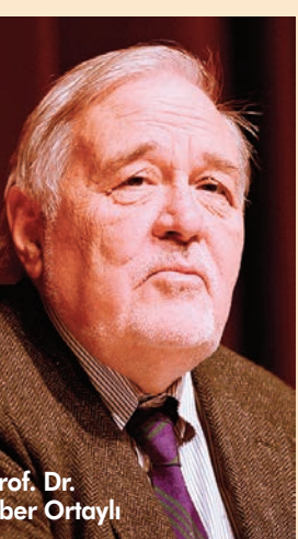
Prof. Dr. İlber Ortaylı

İBB Başkanı Ekrem İmamoğlu'nun yolsuzluk soruşturması kapsamında tutuklanmasına ilişkin tarihçi Prof. Dr. İlber Ortaylı da açıklama yaptı. Ortaylı, tarihi günler yaşadığını, seçimle gelenin seçimle gitmesi gerektiğini vurguladı. "Bundan 45 yıl önce darbe zamanı tutuklanan tüm siyasi isimler daha sonra yeniden iktidara geldi" diyen Ortaylı, "Demirel, Ecevit, Baykal... Halkımız sandığa ve seçilmiş saygı gösterilmediğinde bunu hiçbir zaman unutmadı; ilk fırsatta cevabını sandıkta verdi. Yıllar geçiyor, yöntemler değişmiyor. Yine tarihi günler yaşıyoruz. Halk sandıkta kullandığı oyu, seçtiği yöneticiyi takip ediyor ve mesajını çok net veriyor: Seçimle gelen seçimle gitmeli. Bugün ise toplum gergin, gençler huzursuz ve gelecekte endişeli. Artan siyasi kutuplaşma ve belirsizlik ortamı, gençlerin zihinlerinde "Ne olacağız?" sorusunu giderek daha baskın hale getiriyor. Ülkenin siyasi hayatı, belediyelerden merkezi yönetime kadar birkaç vilayete sıkışmış durumda. Bölgecilik, her ne kadar yasalara uygun görünse de, tasvip edilemeyecek ölçüde yerel partizan eğilimlere ve güçlü bir nepotizme dayanıyor. Peki ya diğer şehirlerde yaşayan, yıllarca eğitim gören, yabancı dil öğrenen, kendini yetiştiren gençler ne olacak? Bu çocukların