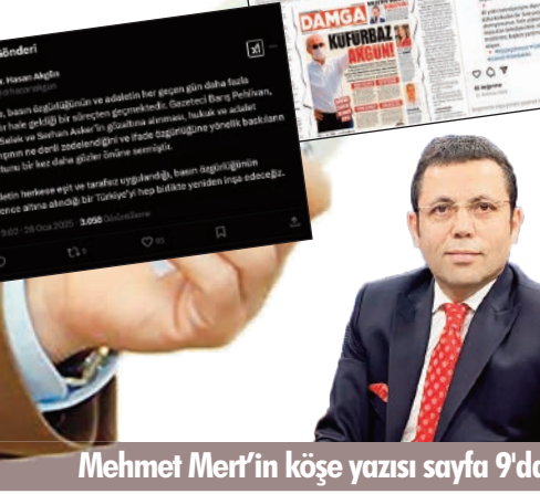
Mehmet Mert'in köşe yazısı sayfa 9'da

süre 'gazetecilik' yapmaya devam edecek. İşin ucunda gözaltı, hapis cezası, ölüm bile olsa. Bundan hiçbir şekilde şüphelenmemsin" diye yazdı. 1 SAYFA 9