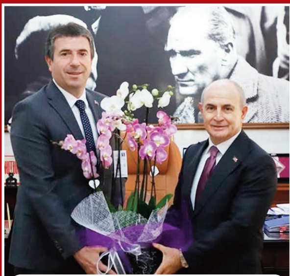
Büyükçekmece Belediye Başkanı Hasan Akgün'ün 2024 yerel seçimleri sonrası her defasında "Ben bir mazbata değil, Silivri ve Çatalca'yı da alarak üç mazbatalı belediye başkanımıyım artık" dediği de gelen duyurular arasında.