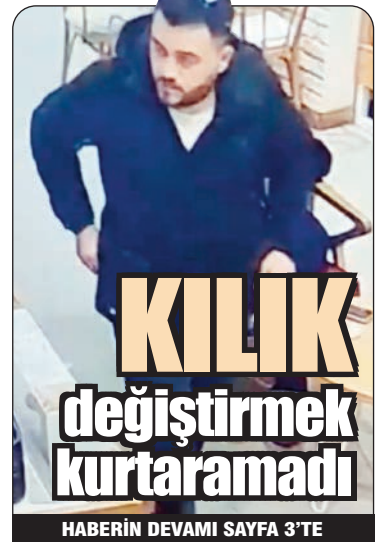
KILIK değiştirmek kurtaramadı HABERİN DEVAMI SAYFA 3'TE

Bu sezon şampiyonluk parolasıyla yola çıkan Avcıarspor, Eyüp Stadyumu'nda karşılaştığı rakibi Alibeyköy Parsellerspor ile 1-1 berabere kalarak, şampiyonluğa ulaştı. Karşılaşmanın ilk yarısı 1-0 geride kapatılan sarı siyahlı ekip, ikinci yarıda penaltıdan bulduğu golle skoru eşitledi. Bu sonuçla birlikte en yakın rakibi Parsellerspor'a 2 puan fark atmayı başaran Avcıarspor adını Süper Amatör Lig'e yazdırmayı başardı.