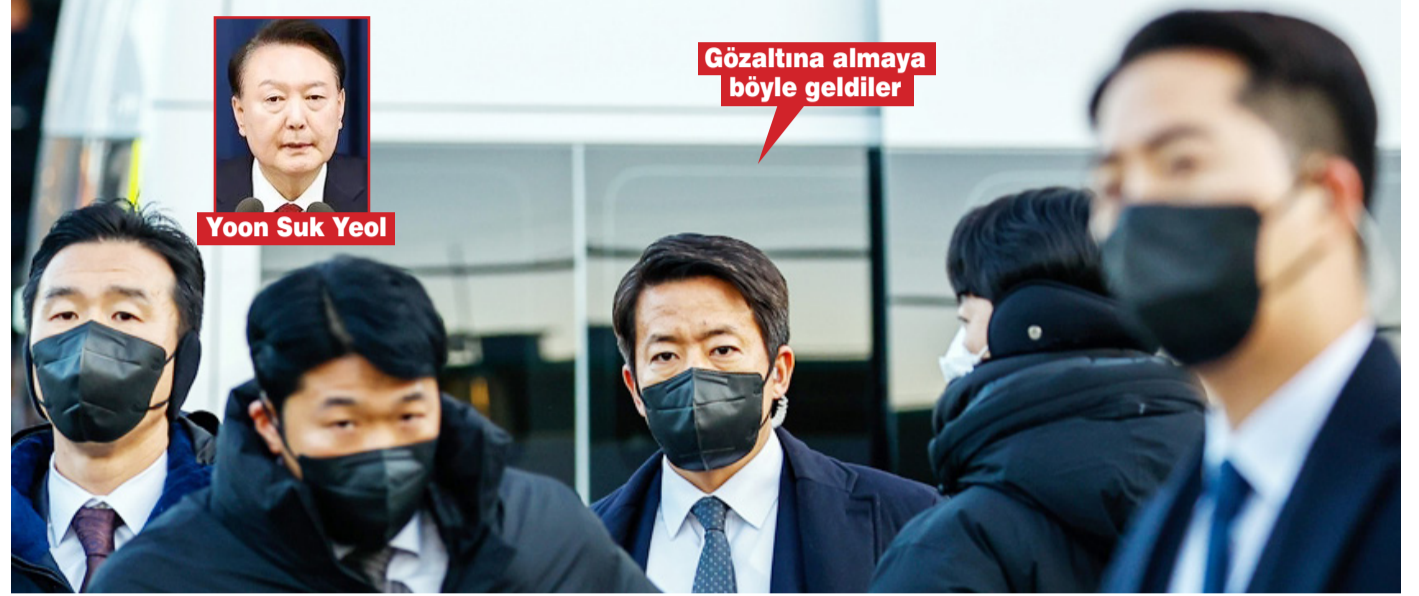
Yoon Suk Yeol