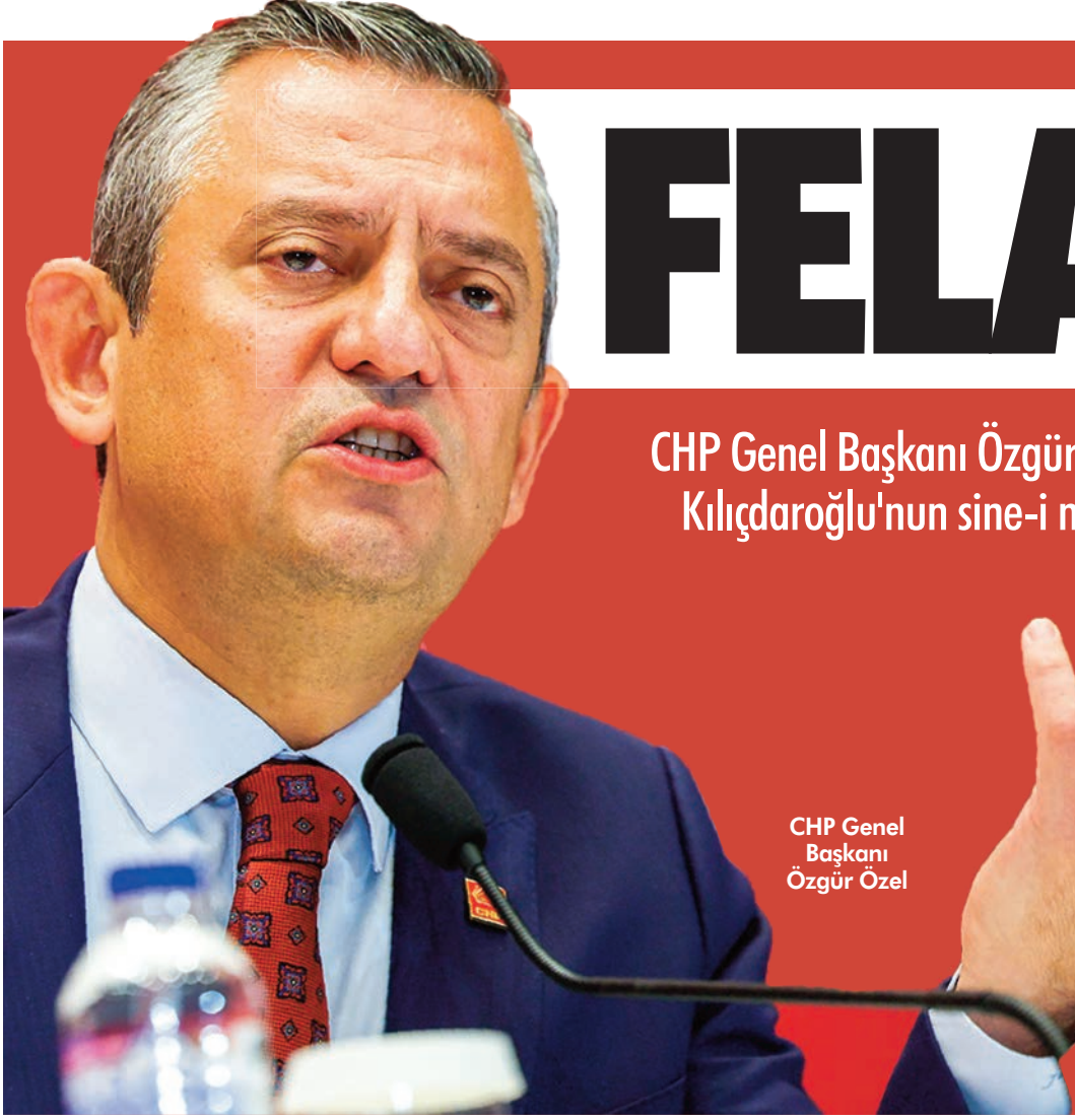
CHP Genel Başkanı Özgür Özel

CHP Genel Başkanı Özgür Özel, CHP grup toplantısını dün Avcılar'da yaptı ve önemli mesajlar verdi. Selefi Kılıçdaroğlu'nun sine-i millet çıkışına tepki gösteren Özel, "Sine-i millet demek istifa et git demek, seçime zorlamak için. Bizim sine-i millet ara seçim doğurur; felaket doğurur. Mecliste kalıp erken seçim için her mücadeleyi yapmak lazım" dedi